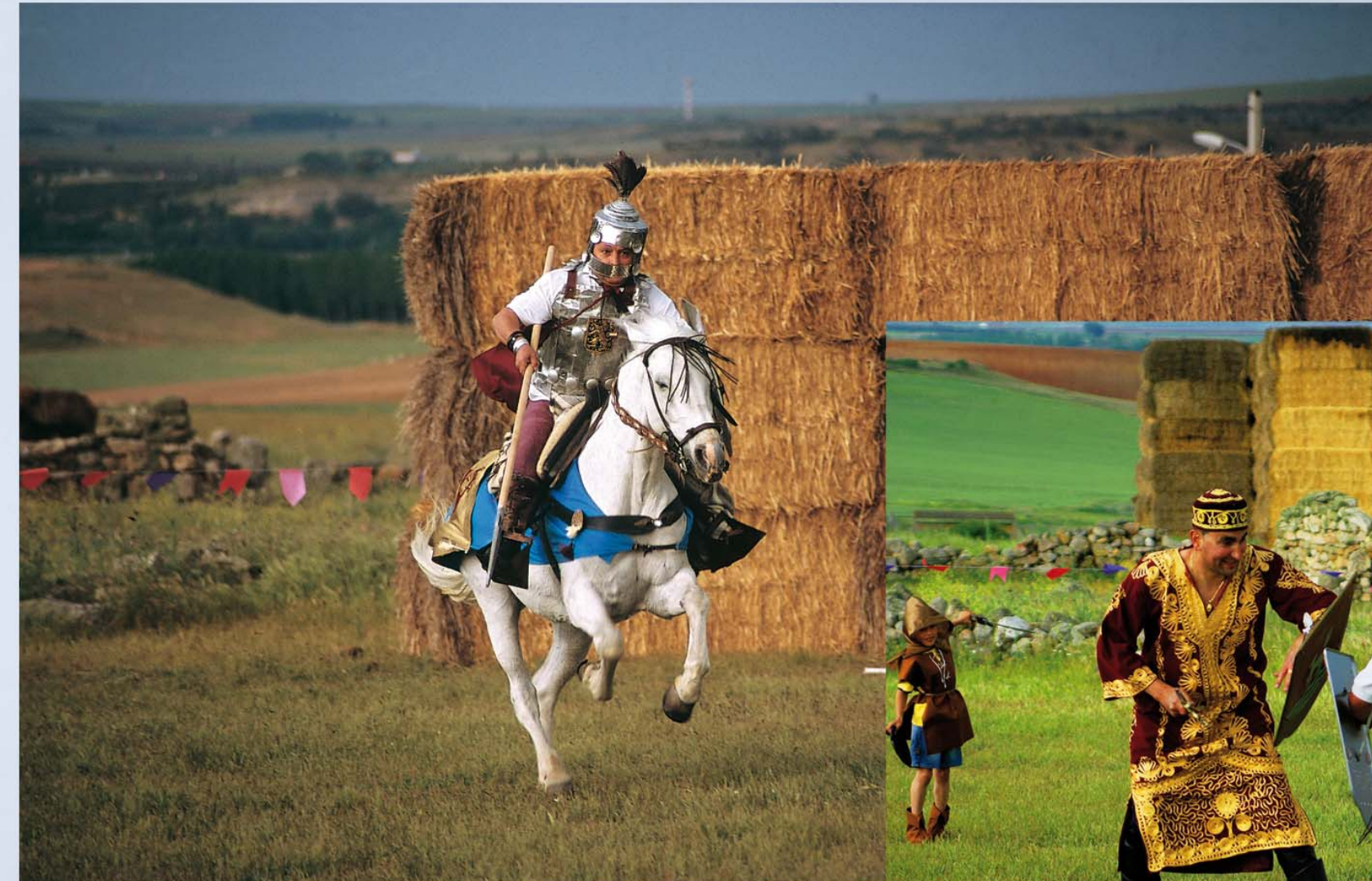
Recreación de Bernardo del Carpio

Bernardo del Carpio es una figura poco reconocida por la historia pero muy extendida por la literatura popular. Mucho antes, en la Edad del Bronce, el más alto de estos cerros fue elegido para un importante castro.