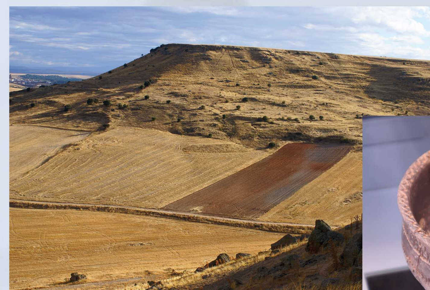
La Mesa del Carpio desde el castillo del Carpio

Las rocas que coronan estos cerros son areniscas anteriores al Eoceno, más duras que las que aparecen unos kilómetros río abajo. Se formaron hace unos 40 millones de años sobre arenas y limos de un sistema de ríos y lagos bajo un clima tropical. El nivel más alto de estos cerros señala aproximadamente la cota en la que se asentaban aquellos cauces.