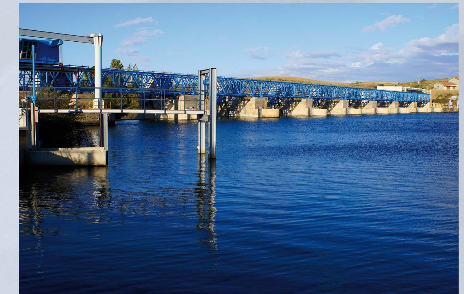
Presa del azud de Villagonzalo.

Es una Zona Húmeda Catalogada por sus notables valores ornitológicos, especialmente como lugar de invernada de aves acuáticas. Tiene una capacidad de embalse de 6hm3 y su regulaje llega prácticamente hasta Alba de Tormes. Su finalidad es el regadío.