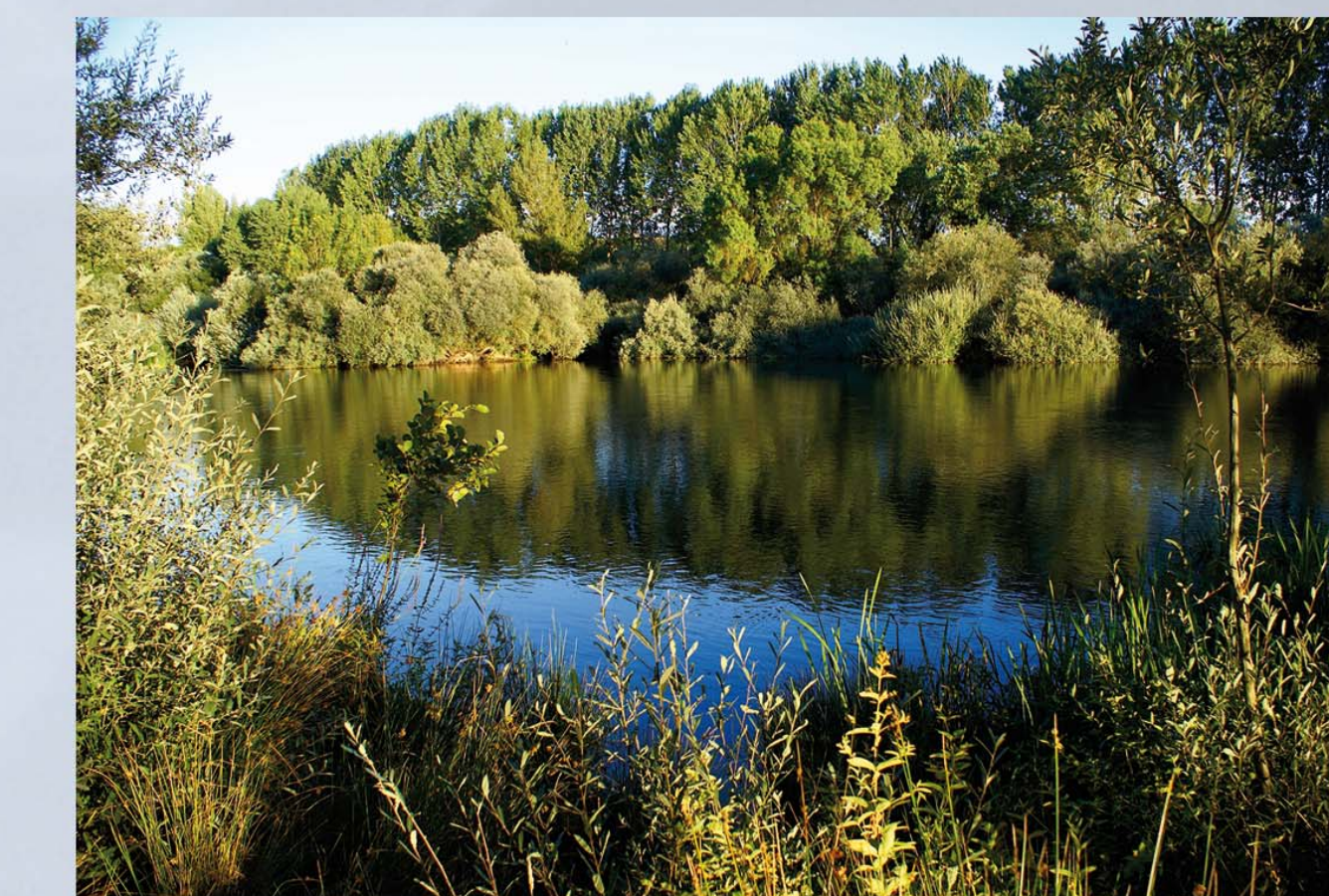
El Tormes en Villagonzalo

A partir del azud de Villagonzalo se encuentra otro de los tramos de la Red Natura 2000. Las riberas conservan saucedas y alamedas, galerías de alisos y setos. Entre la fauna destacan mamíferos como la nutria paleártica y anfibios como el sapillo pintado ibérico, con comunidades de aves cambiantes a lo largo del año. Dentro del LIC se incluye la desembocadura del río Almar; un caudal intermitente y boscoso por los paisajes mudéjares de la estepa.